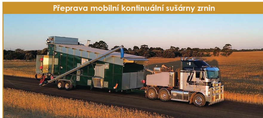
Přeprava mobilní kontinuální sušárny zrnin

Součástí dodávky sušárny je rozvaděč. V základním provedení je na dveřích rozvaděče tlačítkový ovládací panel s indikátory provozního stavu. Jako alternativu nabízíme PLC systém s dotykovým displejem pro rozšířené možnosti řízení, zálohování provozních dat a napojení na vyšší řídicí systém. Veškeré popisy ovládání a návody pro obsluhu a údržbu jsou v češtině.